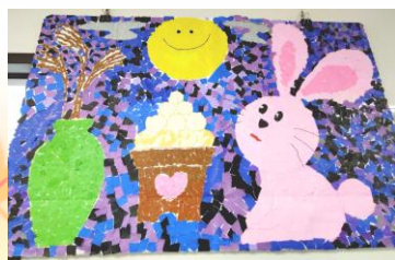
▲九月の壁面制作。 ちぎり絵で仕上げました。