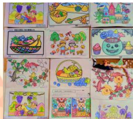
▲芸術の秋にふさわしい すてきな作品が揃いました。